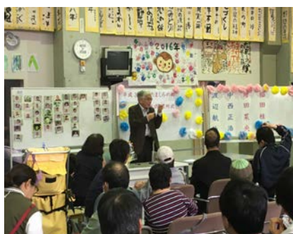
開所式・入所式の様子

他にも体重の増減で一喜一憂したり、視力の低下を嘆くなかま、様々な表情が見られました。