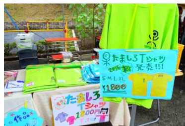
なかまの手作りの作品を販売しました 新しい黄緑のたましろTシャツも販売開始！

毎年天気が心配されるたましろの夏祭り、今年も当日の朝までは雨がぱらついていましたが、なんとか持ちこたえました。多くのボランティアさんのご協力、ありがとうございました。