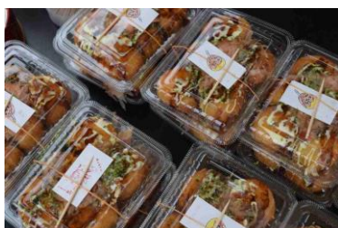
なかまの屋台で揚げたこ焼きを販売しました

舞台では、なかまの希望による、尻相撲大会、ダーツ（なんと、大きな的は手作りでした）を行いました。勝った人は、見事、景品のお菓子をゲットしました！優勝者はメダルも受け取りました。