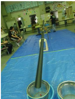
雨どいを使っています

7月の全体レクは、流しそうめんでした。昨年初めてやってみて、楽しかったので今年も希望がありました。残念ながら雨の1日となりましたが、作業棟の中に長い長い樋を使った流し台をセットし、夏らしいカラフルなそうめんや、ミニトマト、うずらの卵なども流しました。水の勢いがあるとキャッチするのは大変でしたが、上手にたくさん食べたなかまもいました。8月の全体レクは、みんなで川遊びをする予定です。