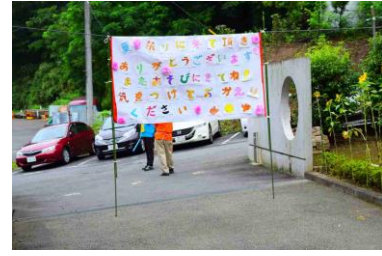
お神輿、ちょうちんの絵、来場された方へのお礼の看板も、なかまの手作りです