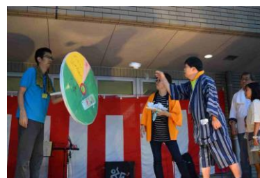
尻相撲に、ダーツ大会！

施設の中では日ごろの創作活動で描いた絵を飾ったり、作成した自由作品の販売も行いました。