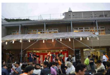
盛り上がった舞台