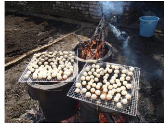
どんど焼きの様子です。