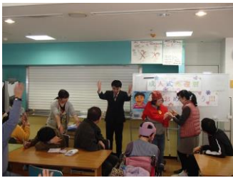
成人式、還暦、おめでとう！

2月の全体レクでは、青梅市の藍染工房「壺草苑（こそうえん）」に見学に行きました。布が綺麗な藍色に染まるまでの行程を説明していただき、大きな釜にもびっくりしました。小さい釜でも、深さが1.5mもあるそうです。一言で藍色といっても、濃いものや薄いもの、チェック柄やしましまになっているようなものもありました。濃くするには、20回くらい浸けて乾かしてを繰り返すそうで、大変な時間がかかっていることがよくわかりました。「どんなことが大変ですか？」「雨の日はどうやって乾かすのですか？」「完成した布はいくらで販売するのですか？」等、なかまもたくさん質問していました。