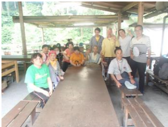
ここでバーベキューをしました

盛りだくさんの夏休みとなりました。これから夏の疲れもでてくると思いますが、楽しく元気に過ごしていきたいと思います。