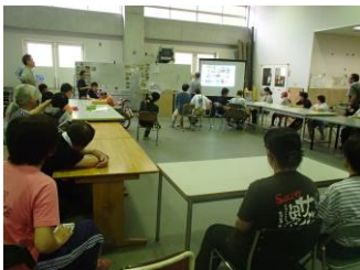
机をコの字に配置しています

皆さんも、ぜひなかまの報告を見に来て、一緒に話しをしていただきたいと思います。お話が好きな方、お待ちしております。