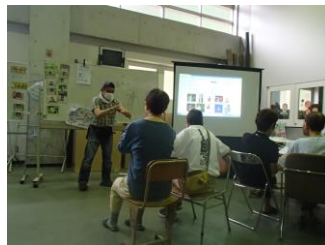
スクリーンに映しているところです