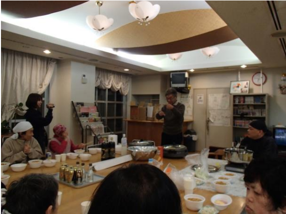
大みそか 1年間おつかれさま！

・大晦日、なかまは夕食の時間になるとソワソワした様子。夕食は施設長の「たくさん食べて飲んで下さい」の挨拶とともに乾杯！！年越しそばと、すき焼きをたくさん食べました。何日も前から、この日にビールを飲むのを楽しみにしているなかまもいて、顔を真っ赤にしてほろ酔いになっていました。年末は、家に帰宅するなかまが多く、たましろに残っているなかまの数は少なく、テーブルをみんで囲む形での食事でした。お互いの顔を見ながらの食事はいつもよりも会話が弾んでいました。紅白歌合戦が終わるころには全員お部屋に戻り、翌日の初詣に備えて寝ていました。