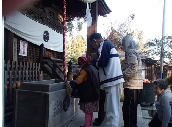
初詣 願いが届きますように！

・元日、なかまは青梅市内の住吉神社へ初詣に行きました。あの急な階段をのぼるなかまもいましたが、最後の方は息が切れそうになり足取りが重く…。手を清めた後、パンパンと元気に拍手し、お願いをしました。願い事はなァに？となかまに聞いても、ニコッと笑顔で「内緒っ♪」と教えてくれませんでした。きっと素敵なお願いだったに違いありません。初詣の後は青梅駅周辺を散策し、たましろへ戻りました。